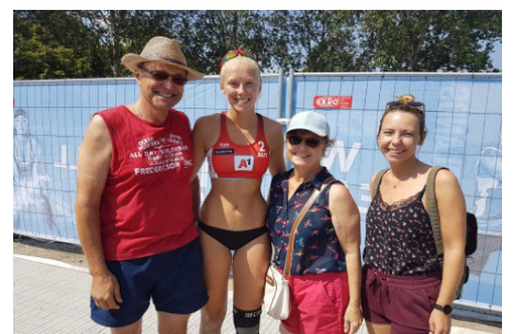
Wir waren mit dabei!